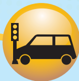
Manejar con precaución.