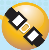
Usar cinturón de seguridad.