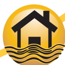
El incendio o inundación de tu hogar.