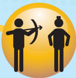
Evitar actividades peligrosas.